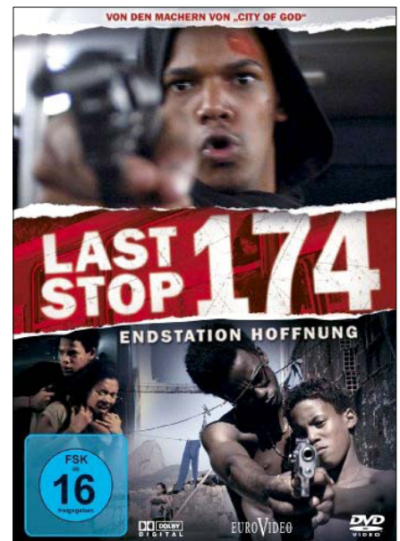
Última Parada 174 Regie: Bruno Barreto Brasilien, 2008

Die geradlinige Dramaturgie geht mit einer ausgezeichneten schauspielerischen Leistung der jugendlichen Hauptdarsteller einher. Auch die Dialoge überzeugen, wirken real und nicht gekünstelt. Und trotzdem scheint gerade gegen Ende die Handlung zu sehr