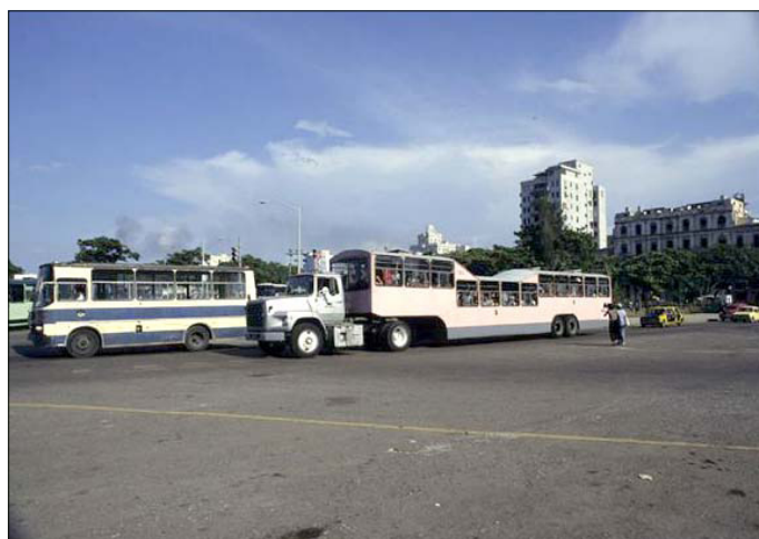
Der Transport bleibt ein Problem